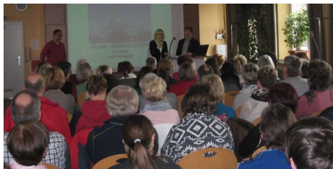
Grundkurs Islam am 05.03.2016

Die KOEF bietet Freiwilligen nicht nur eine Erstqualifizierung (wichtige Informationen zum Start in die ehrenamtliche Flüchtlingshilfe), sondern auch weiterführende Qualifizierungsangebote zu relevanten Themen an.